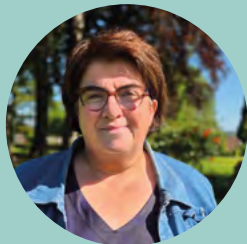
Christine LESUEUR Maire de Forges-les-Eaux