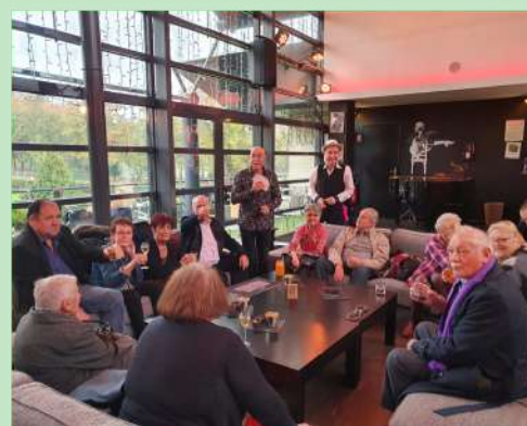
Spectacle de magie suivi du repas au Forges Hôtel