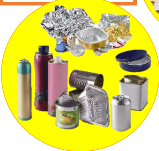
EMBALLAGES EN METAL